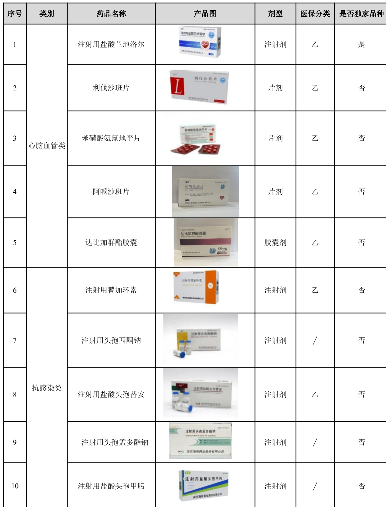
表——2024 年在产品种情况